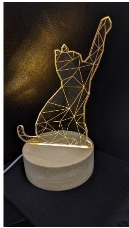
(雷射光雕小夜燈樣本)