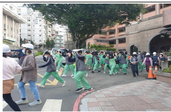
說明：逃生時拿物品保護頭部