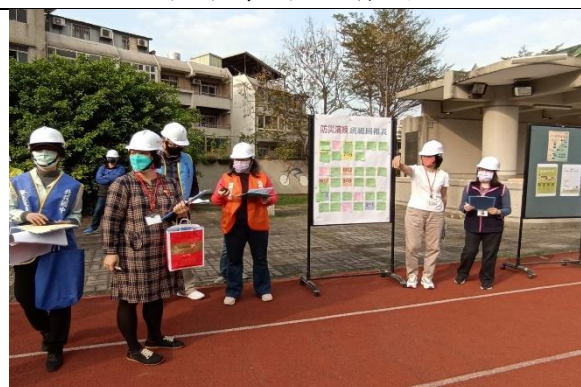
說明：逃到空曠處後人數清點