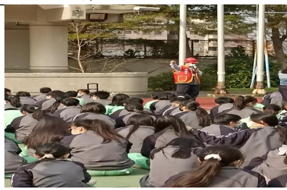
說明：聆聽校長講解防震知識