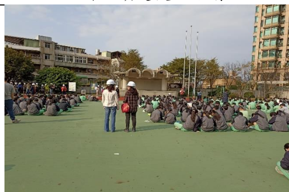
說明：逃到空曠處後原地就坐