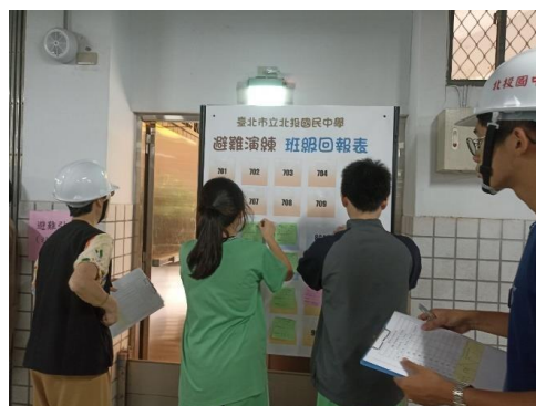
3_防空人員清點暨回報現有人數_2