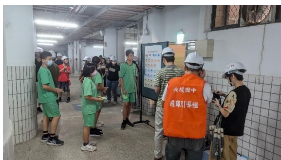
3_防空人員清點暨回報現有人數_3