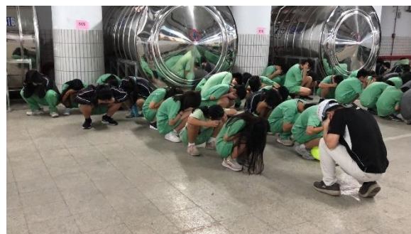
4_空襲警報師生立即採取防空防護動作_1