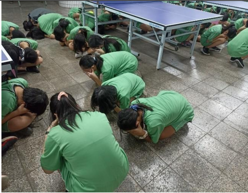
4_空襲警報學生立即採取防空防護動作_2