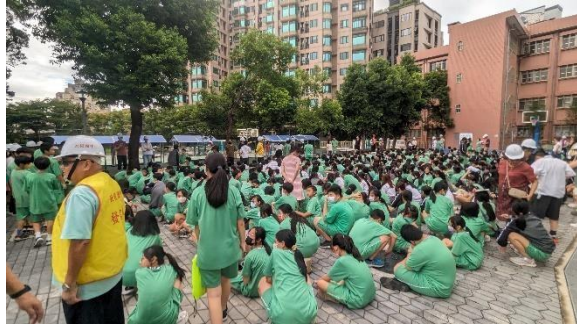
6_全校人員至避難點集合