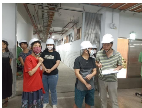
3_防空人員清點暨回報現有人數_1