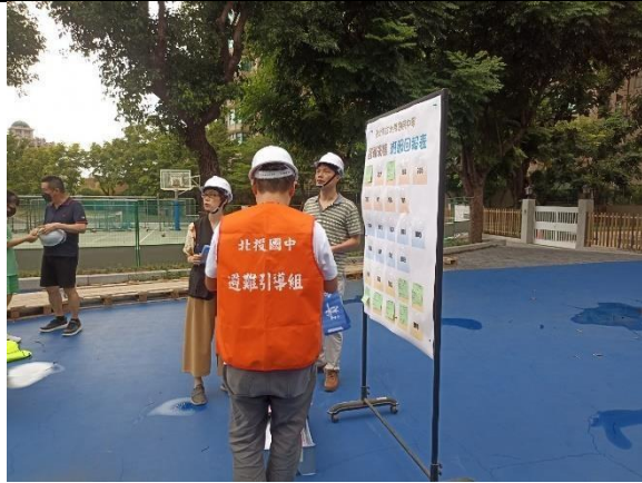
7_地震人員清點暨回報現有人數_2