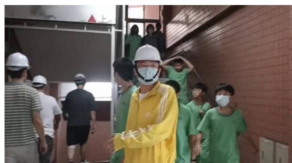
2_全校人員快步移動，不推、不跑，前往防空避難地點