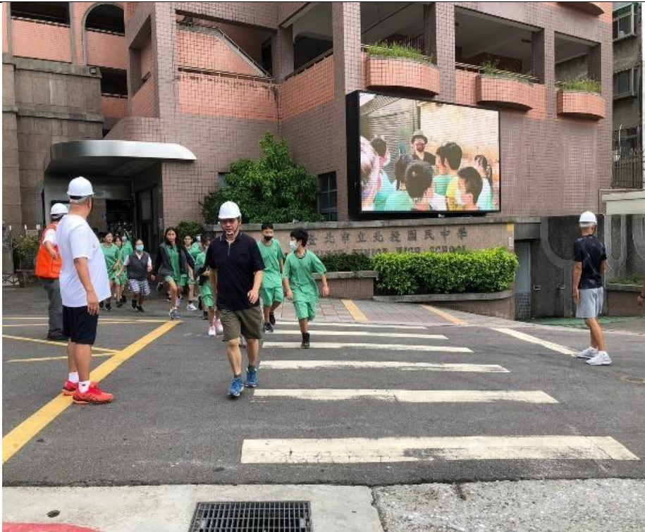
5_接續地震警報全校人員迅速前往地震避難地點