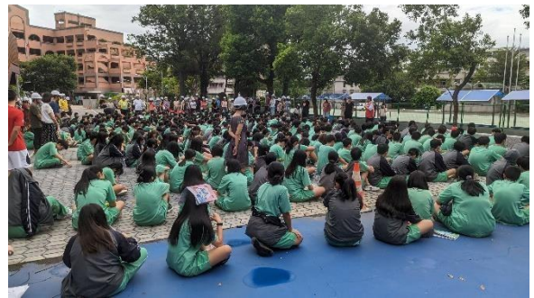
8_指揮官指揮救災任務，並關切學生安全暨宣導災害發生應注意事宜