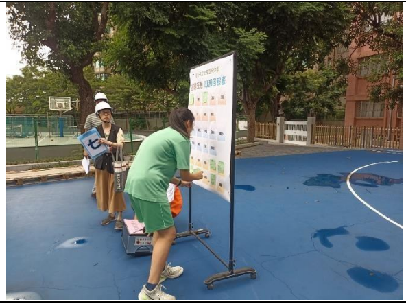
7_地震人員清點暨回報現有人數_1