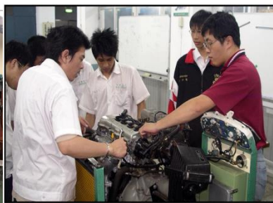
汽油引擎修護實習