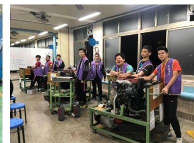
柴油引擎修護實習