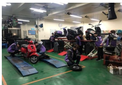
機車維修技術實習