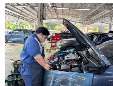
福特汽車 業界實習

學生進路：1. 進入職場工作 2. 選擇升學 3. 日間進入職場工作，夜間科大繼續進修