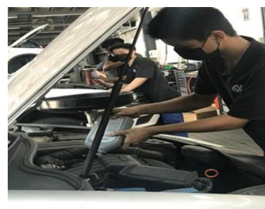
福斯汽車 業界實習