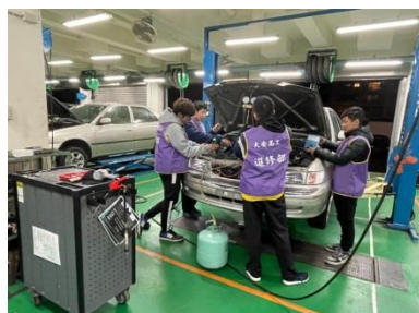
汽車電路(含空調)修護實習