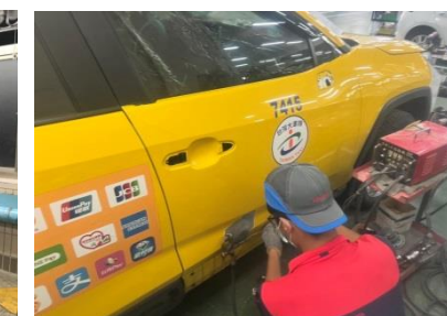
國都汽車 汽車板金業界實習