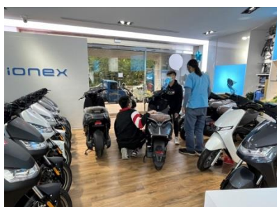
光捷電動機車 業界實習