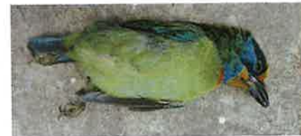
五色鳥是國內最容易窗殺的鳥種