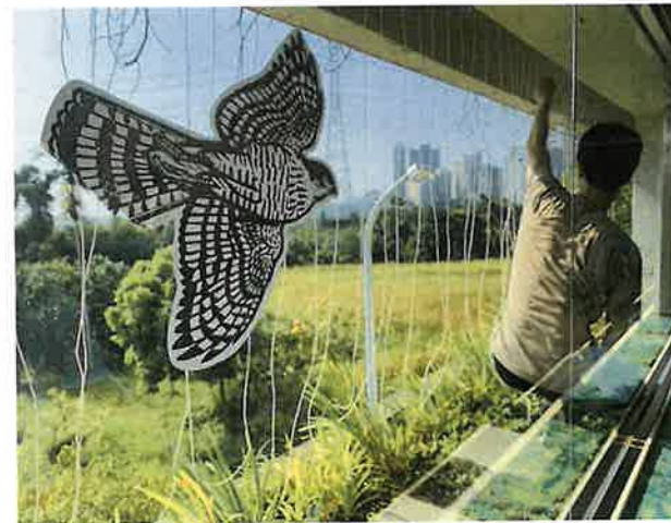
以戶外掛繩的方式來預防野鳥窗殺。