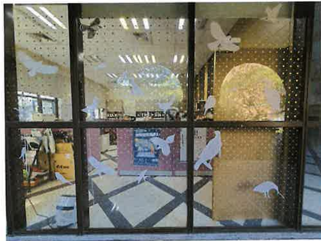
臺灣大學思亮館之鳥類友善窗戶布置。

過去曾提倡使用猛禽圖案的貼紙來防止窗殺，已被證明無法嚇鳥不靠近玻璃，許多張貼稀疏猛禽貼紙的建物仍持續地有野鳥撞窗事件發生。若要使用猛禽貼紙，也要符合「5x10公分原則」來張貼才會有效，可以配合其他的素材，例如圓形標籤貼紙、直條貼紙等來合併布置改善。過去建築物常使用的鐵花窗、壓花玻璃、馬賽克玻璃等其實都是很好的鳥類友善建材，可惜近年來已經不流行了。若您家中、學校、工作場所會有野鳥撞窗，可以嘗試用「5x10公分原則」來布置玻璃，也歡迎大家遇到野鳥窗殺事件能通報臉書社團「野鳥撞玻璃回報」或「台灣路死動物觀察網」，若是想要了解更多窗殺資訊或下載摺頁與教育宣導資訊，歡迎上「野鳥窗殺博物館」網站逛逛。