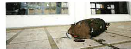
翠翼鳩是國內窗殺第二名