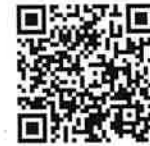
臉書野鳥 撞玻璃 回報社團