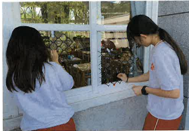
八里國中的學生正在改善教室玻璃。

鏡像反射也是光滑玻璃的特性之一，最普通的透明玻璃在室內暗、室外亮的條件下，也會產生明顯的鏡像反射，若反射對側的樹林、遠景或建築物之間的影像，就會讓鳥兒誤判鏡中的假影是真實世界而全速飛過去，因此導致嚴重的撞傷或死亡。鳥類的飛行能力讓牠們不受空間與高度限制，雖然許多鳥類的視覺和對色彩的辨識能力其實比人類還好，但因為眼睛在頭部的兩側，視野範圍較廣但立體視覺比人眼範圍小，加上高速飛行狀況下反應的時間很短，因此善飛的鳥成爲窗殺最嚴重的受害者。