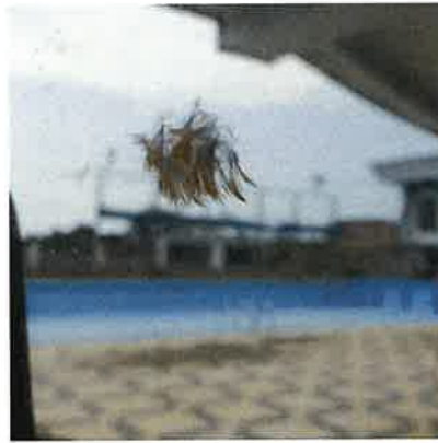
某小型鳥撞窗遺留的羽毛痕跡