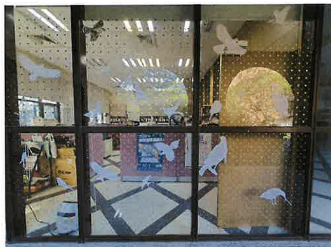
臺灣大學思亮館之鳥類友善窗戶布置。

過去曾提倡使用猛禽圖案的貼紙來防止窗殺，已被證明無法嚇鳥不靠近玻璃，許多張貼稀疏猛禽貼紙的建物仍持續地有野鳥撞窗事件發生。若要使用猛禽貼紙，也要符合「5x10公分原則」來張貼才會有效，可以配合其他的素材，例如圓形標籤貼紙、直條貼紙等來合併布置改善。過去建築物常使用的鐵花窗、壓花玻璃、馬賽克玻璃等其實都是很好的鳥類友善建材，可惜近年來已經不流行了。若您家中、學校、工作場所曾有野鳥撞窗，可以嘗試用「5x10公分原則」來布置玻璃，也歡迎大家遇到野鳥窗殺事件能通報臉書社團「野鳥撞玻璃回報」或「台灣路死動物觀察網」，若是想要了解更多窗殺資訊或下載摺頁與教育宣導資訊，歡迎上「野鳥窗殺博物館」網站逛逛。