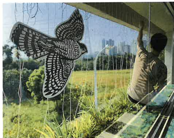
以戶外掛繩的方式來預防野鳥窗殺。