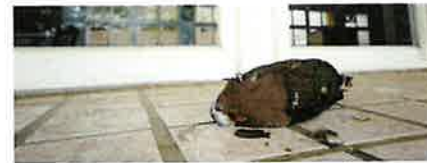
翠翼鳩是國內窗殺第二名