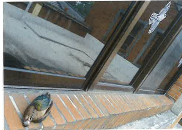
貼稀疏的猛禽貼紙無法預防野鳥窗殺。