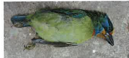
五色鳥是國內最容易窗殺的鳥種