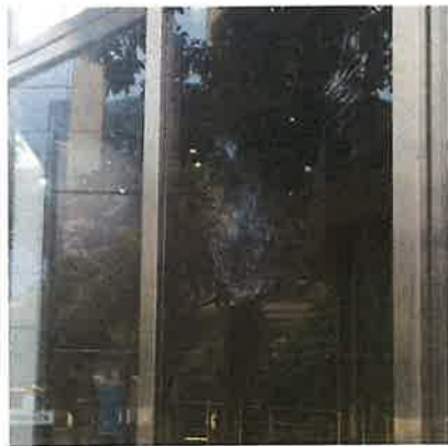
鳩鴿撞窗的鳥拓痕跡

猛禽會與臺灣大學根據「台灣路死動物觀察網」與臉書社團「野鳥撞玻璃回報」所蒐集的近900筆窗殺案例分析，發現五色鳥與翠翼鳩為最易遭窗殺死亡的鳥種，而屬於猛禽的鳳頭蒼鷹亦是名列前茅，這些容易窗殺死亡的鳥類稱為超易撞鳥種(super colliders)。國內超易撞鳥種大多為留鳥，與北美研究多為候鳥很不一樣。